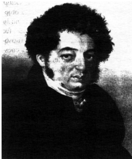
Eduard Gans.

Filósofo del Derecho, jurista, político y articulista también de prensa periódica. Discípulo de Hegel*. Conoció por su disputa con Savigny* en la Universidad de Berlín, de la que fue profesor a partir de 1828.