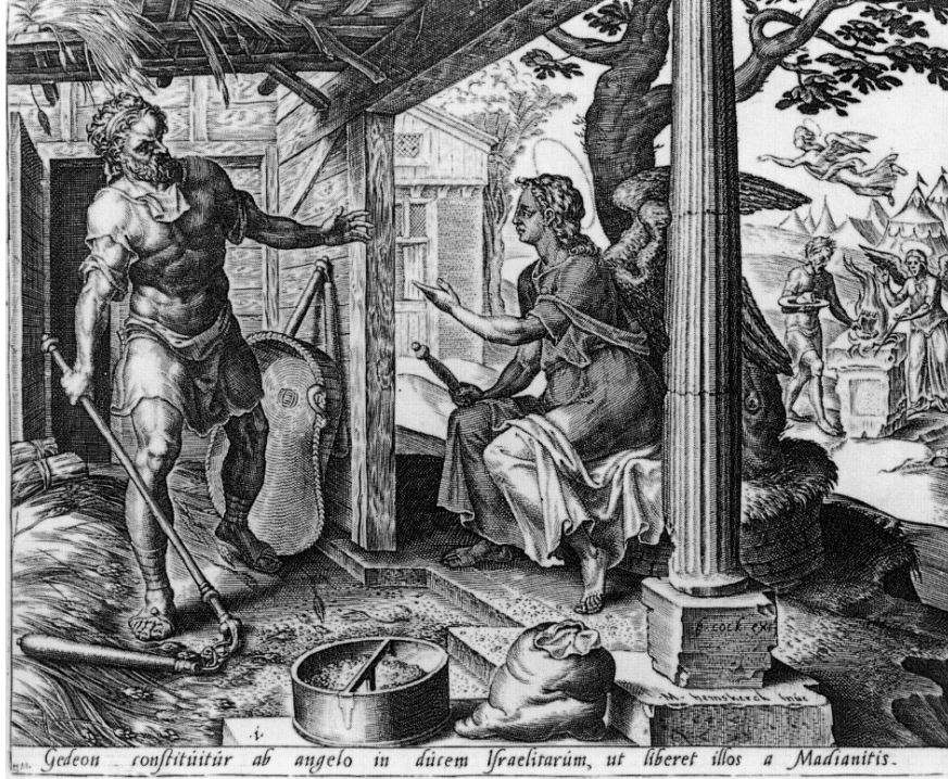
1. Presentación del Ángel ante Gedeón y sacrificio