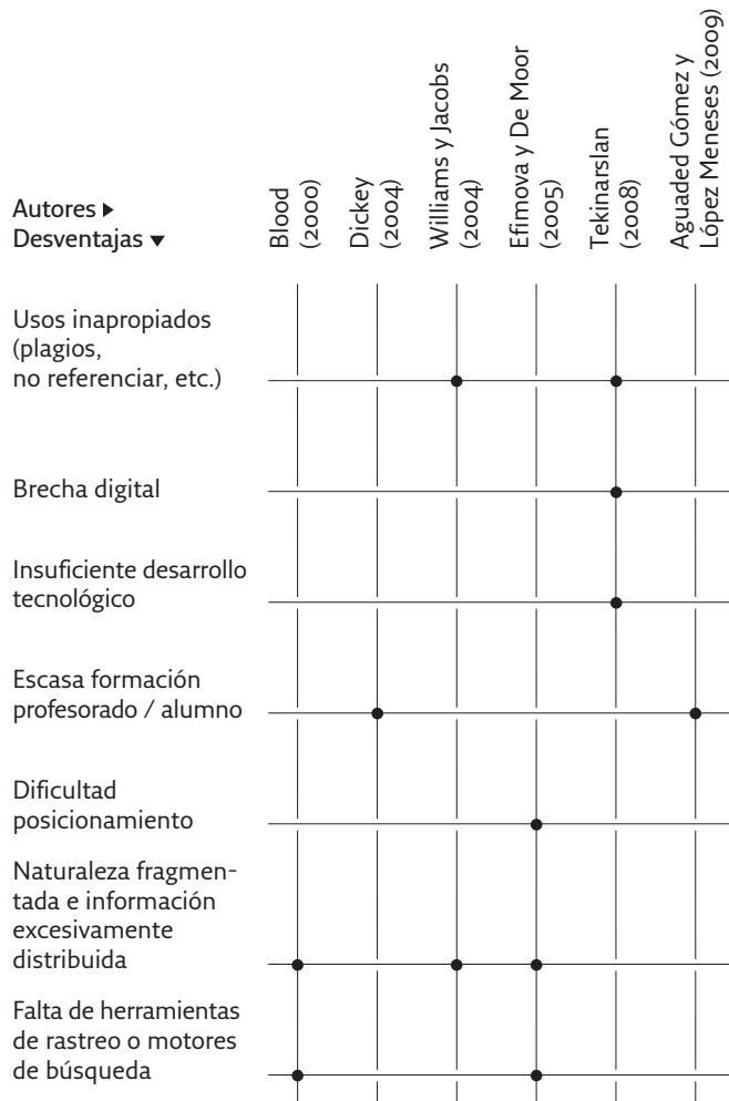
Cuadro 2. Resumen desventajas del uso de blogs -trabajos