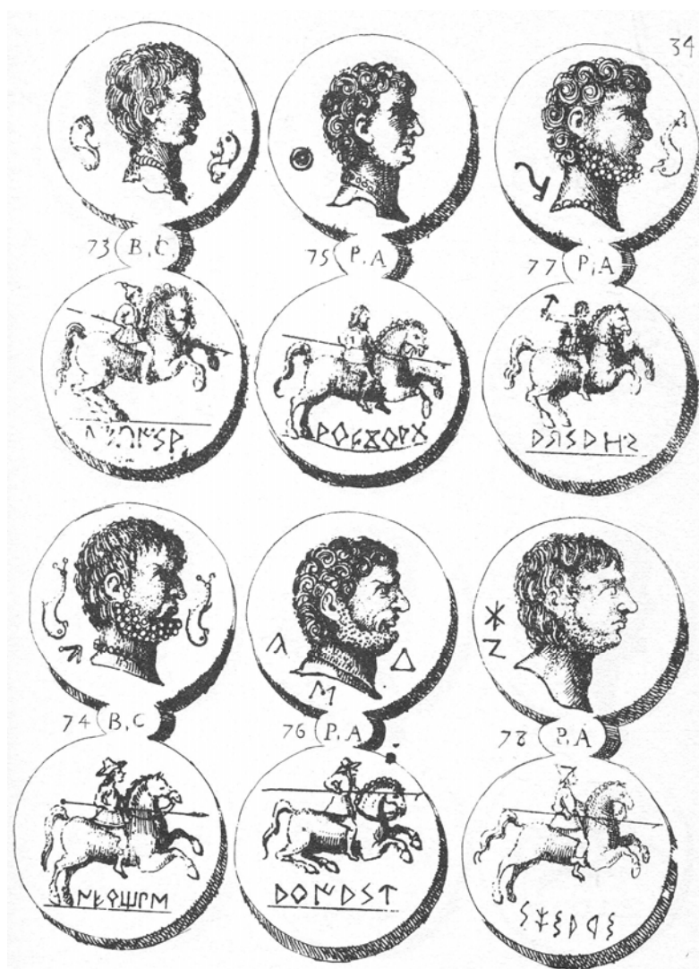
Figura 1. Lámina 34 de la obra de Vincencio Juan de Lastanosa, Museo de las Medallas Desconocidas Españolas , 1645, con moneda de arekorata (nº 75).