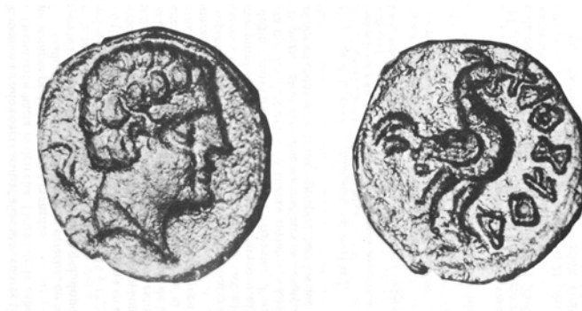
Figura 2. Divisor de arekorata procedente de los alrededores del pantano de Yesa (Almudena Domínguez, 1988, 252) de características similares al aparecido en Torrellas.