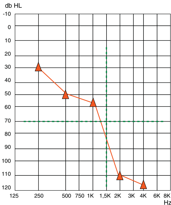
Figura 2 Ejemplo de audiograma para la indicación de una estrategia de estimulación electroacústica o híbrida con preservación de audición tras la colocación de un implante coclear.

*El material empleado en la realización de la audiometría verbal puede ser de una gran variedad. Se recomienda utilizar un protocolo básico de valoración que al menos incluyese las siguientes listas: vocales, palabras cotidianas, bisílabas y frases 11 . Así mismo, resulta de gran interés conocer en qué medida los resultados alcanzados en estas pruebas mejoran con el apoyo de la lectura labial y varían en condiciones de ruido ambiental.