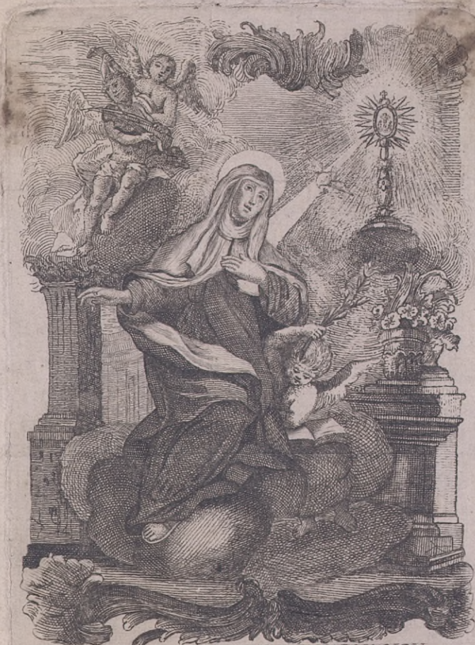
LA B. MARIA DE LA ENCARNACION. Fundadora de la Reforma de Francia Abogada de accidentes repentinos Murio año 1618. Cuco, la G.