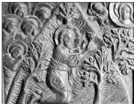
Figura 10. La escena del vigésimo panel: Jesús ora en el huerto de los olivos.