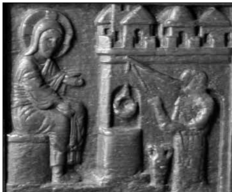
Figura 6. La escena del duodécimo panel: Jesús habla con la Samaritana.