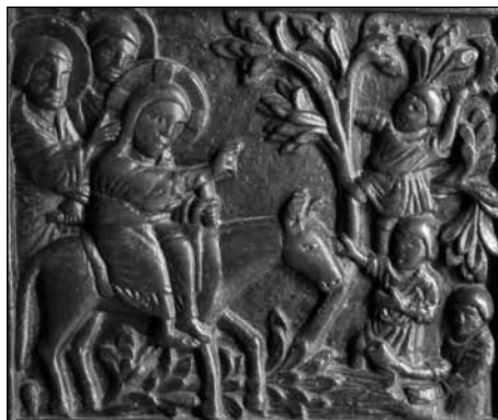
Figura 8. La escena del décimo séptimo panel: La entrada solemne en Jerusalén.

La mayor parte de las puertas medievales historiadas conservadas en Europa no tienen una gran semejanza con la del maestro Buvina, ni en la disposición de las escenas ni en la ornamentación. Hay unas pocas que si se asemejan, aunque esto no indique una mutua dependencia.