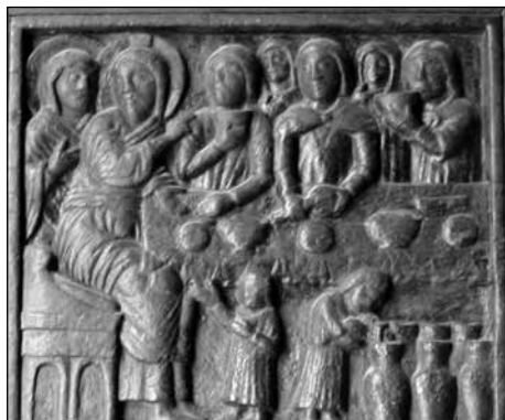
Figura 4. La escena del noveno panel: El milagro de Jesús en Caná.