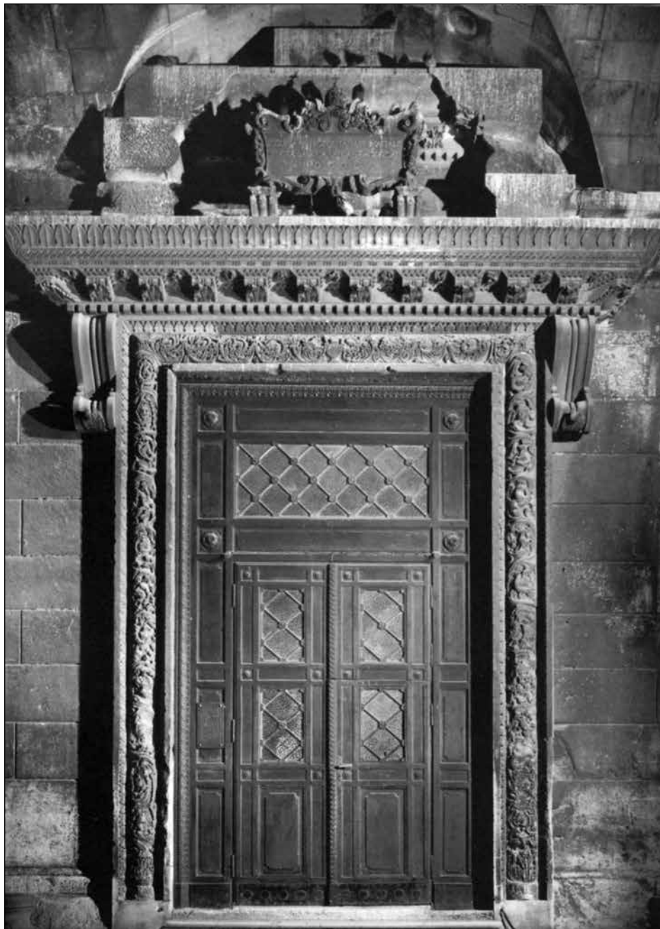
Figura 1. La portada de la catedral. (Foto del libro de Kruno Prijatelj [ver bibliografía]).