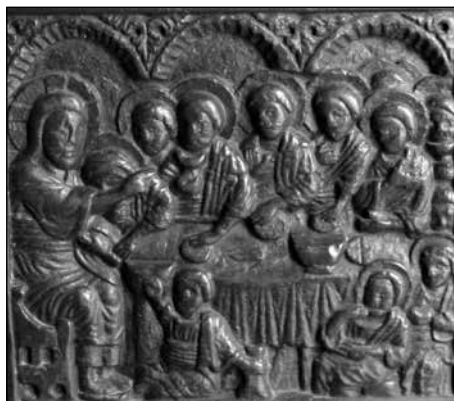
Figura 9. La escena del décimo octavo panel: La última cena.