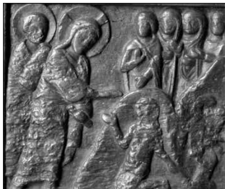
Figura 5. La escena del undécimo panel: La liberación del endemoniado de Gerasa.

Siguen las escenas: Jesús hablando con la samaritana en el pozo (fig. 6), La curación del ciego de nacimiento y la Resurrección de Lázaro .