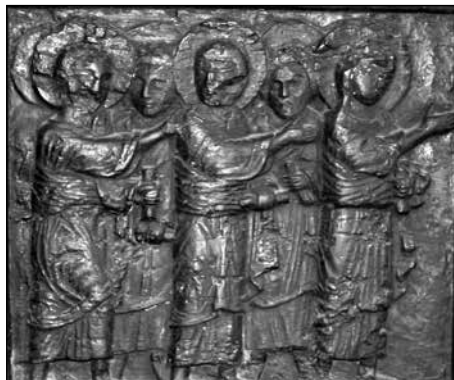
Figura 7. La escena del décimo quinto panel: La misión de los setenta y dos discípulos.

nosotros, era famoso en Split, por que desde tiempos inmemoriales era recitado, y solemnemente cantado en la catedral durante la misa de la fiesta de san Domnius, protector de la ciudad, como queda testimonio en una nota marginal del célebre Evangeliarium Spalatense , códice escrito entre los siglos séptimo y octavo. Este santo mártir, habría sido según su legendaria Passio , discípulo apóstolico («missus Salonam a Petro, apostolorum Principe»), formando parte, por tanto, al menos simbólicamente, del número de los primeros discípulos. A esta escena, le sigue la de el Llanto de Jesús sobre Jerusalén , al igual que la anterior muy poco frecuentes en la iconografía medieval, como bien señala Karaman.