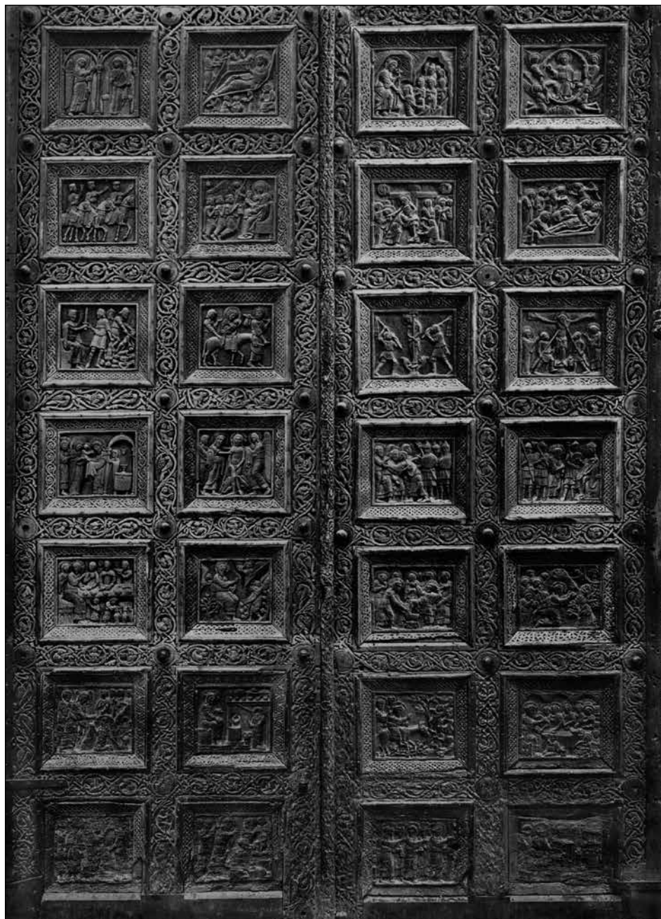
Figura 3. Los dos batientes entallados e ilustrados.