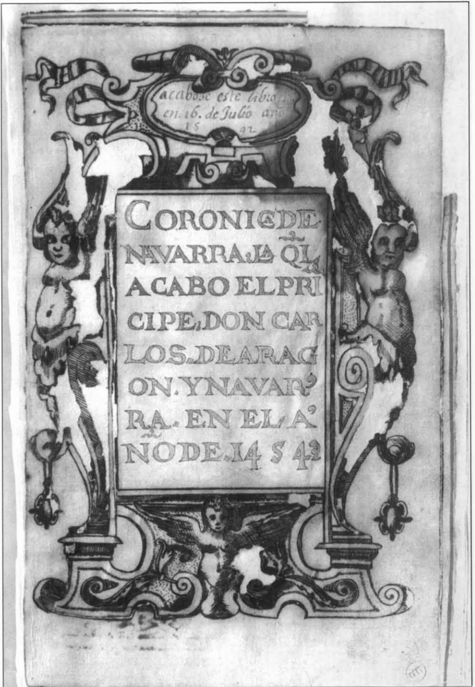
Lám. 2. Portada