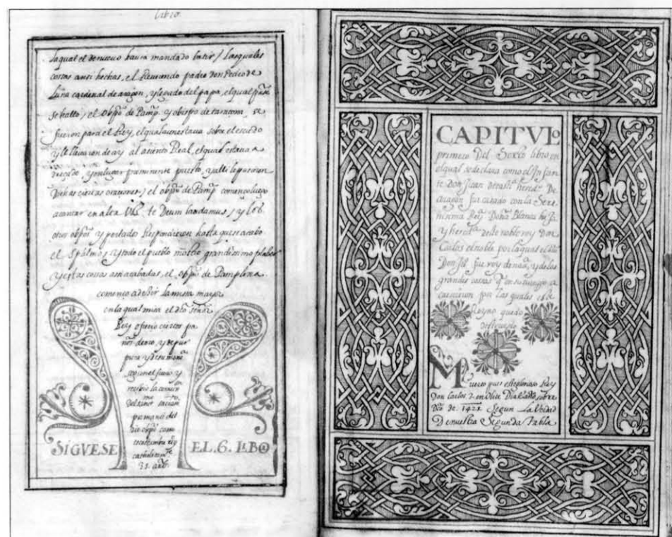
Lám. 5. Comienzo del Libro VI