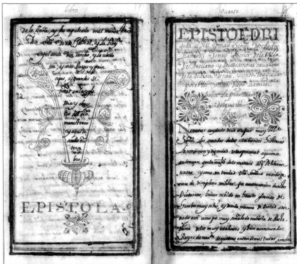
Lám. 4. Epistola con la que comienza el Libro IV