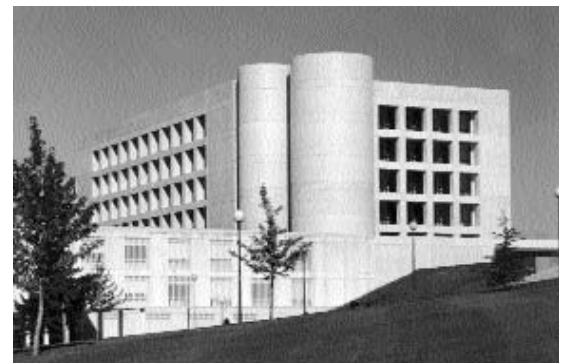
Ampliación de la Biblioteca, Universidad de Navarra

No está de más considerar la devoción a la Virgen y las obras de misericordia como signos de identidad... son los temas de los vídeos que se presentan en la sección de Audiovisuales.