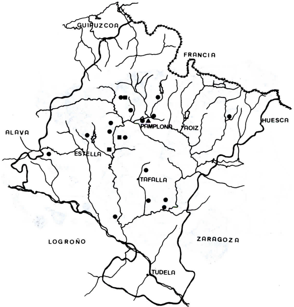
Fig. 2.- Distribución del género Calliptamus en Navarra. ●, C. italicus ; ■, C. wattenwylanus ; ▲, C. ictericus .