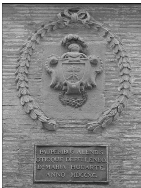
Fig. 2. Escudo de la familia Huarte e inscripción en recuerdo de la fundadora.