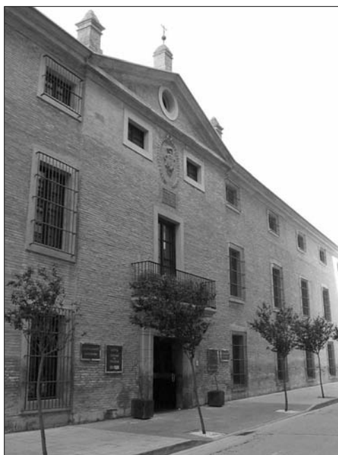
Fig. 1. Fachada del edificio fundacional de la Real Casa de Misericordia, hoy convertido en hotel.