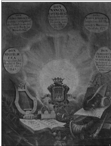
Fig. 3. Cuadro de Miguel Sanz y Benito con los benefactores de la ciudad.