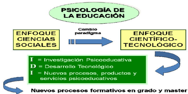
Figura 1. Cambio que debe sufrir la Psicología de la Educación.