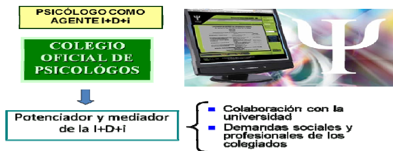
Figura 2. Psicólogo como agente I+D+i