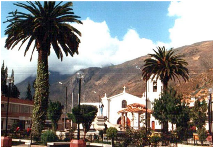
Figura 2: Iglesia parroquial de Palca.

de tierras comunitarias, que pasaron a la corona y fueron luego compradas por españoles para establecer haciendas. A la altura de 1644, la doctrina contaba con 876 habitantes 6 (figura 2).