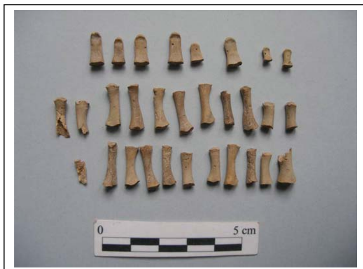
Figura 10.- Restos de manos y pies.