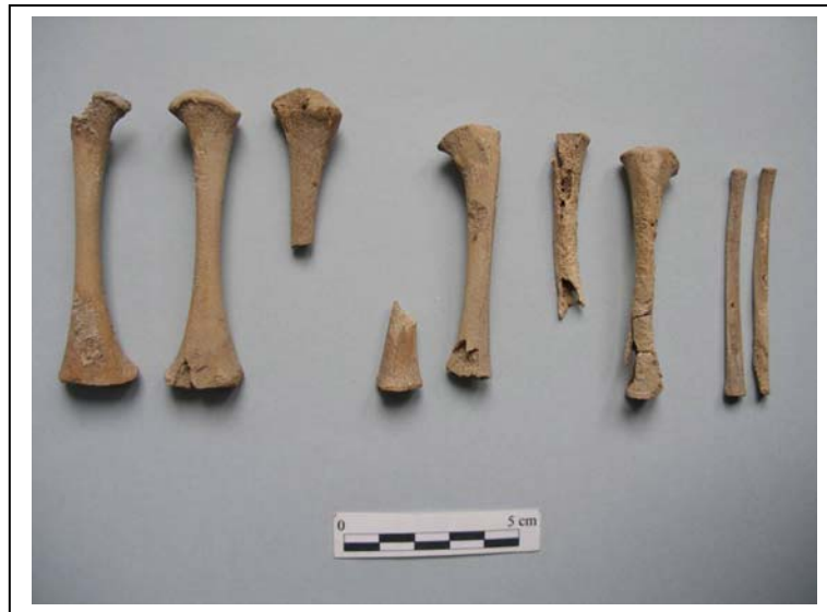
Figura 11.- Huesos de las extremidades inferiores