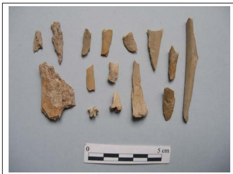
Figura 3.- Restos de fauna identificados junto a los restos humanos.

Procedimos a la elaboración del inventario de los huesos y fragmentos conservados, respetando las referencias identificativas de cada conjunto.