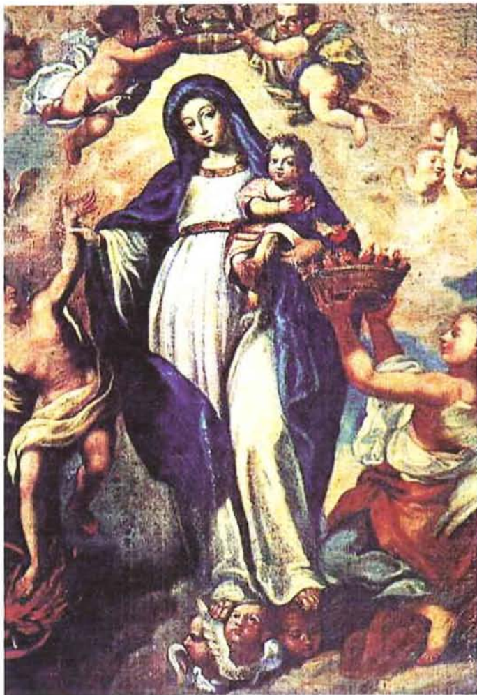
Fig. 1. Anónimo, La Madre Santísima de la Luz. Óleo sobre tela, Catedral de León, Guanajuato, México

el bíblico Leviatán (Sal. 74,14), monstruo marino que desde el medioevo se había convertido en el símbolo de la puerta del infierno, al representarse tragando a los condenados.