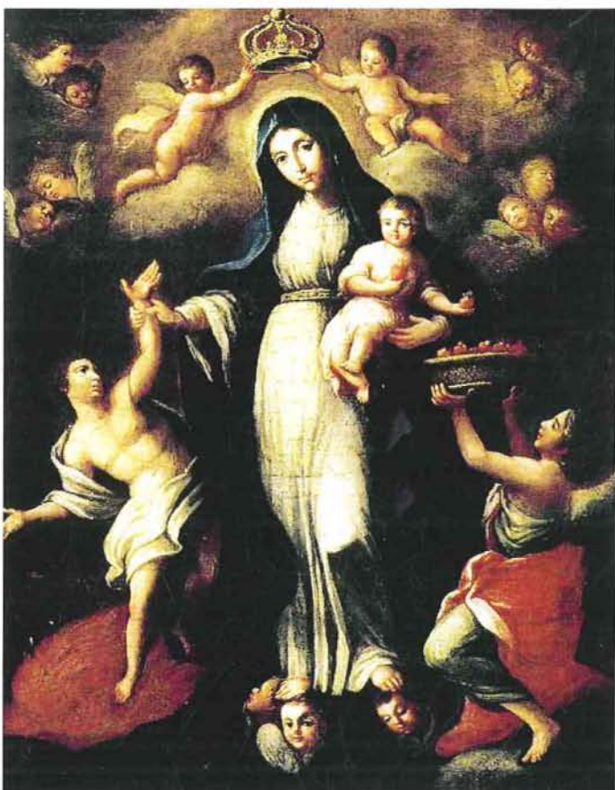
Fig. 3. Anónimo, Nuestra Señora de la Luz. Óleo sobre tela, Fundación Galería de Arte Nacional, Caracas.

Las enmiendas realizadas a las obras caraqueñas no llegaron a suprimir totalmente la identidad de la Madre de la Luz, ya que en su mayoría mantienen la filacteria con el nombre original, pero ciertamente atentaron de manera definitiva contra la composición y el sentido de las obras. La supresión de la figura del alma introduce un cambio que incluso desvirtúa el concepto de Madre intercesora de la iconografía original. Esta enmienda, distinta a la apuntada en otras partes de Sudamérica, que no llega a desfigurar totalmente la imagen, podría explicarse ante la presencia de una devoción fuertemente arraigada entre los caraqueños que encontraron en la imagen un símbolo que identificaba al cabildo local. A su vez, la poca presencia del jesuitismo en la provincia de Caracas pudo ser el motivo para