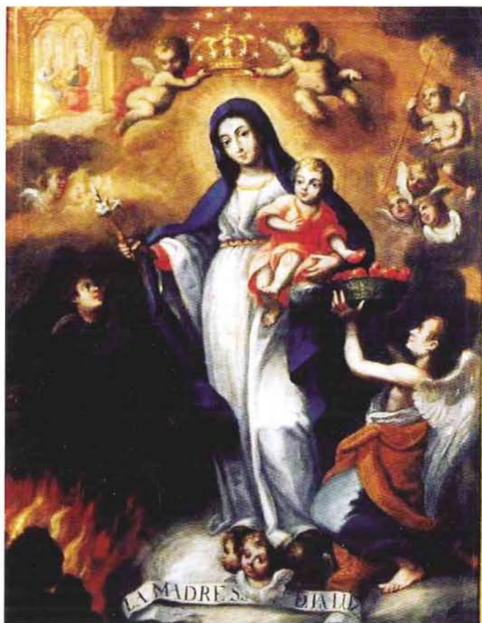
Fig. 4. Atribuido a Juan Pedro López, Nuestra Señora de la Luz. Óleo sobre tela, Iglesia de San Francisco de Caracas.