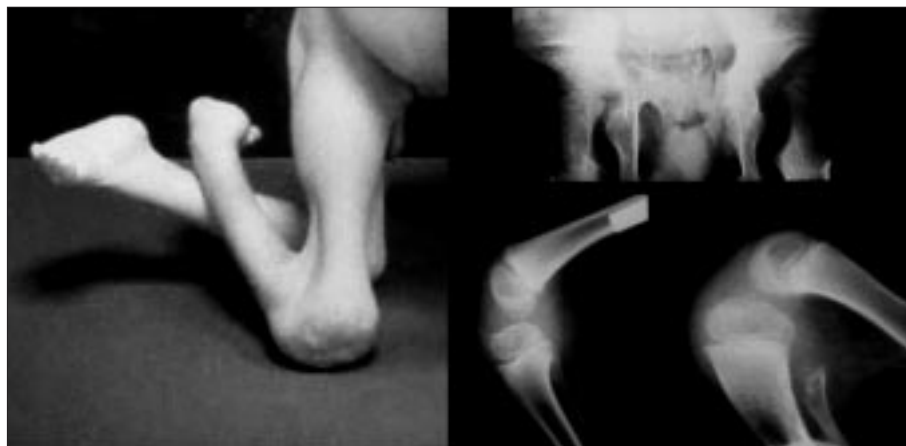
Figura 3. Obsérvese el importante flexo de rodillas con la presencia de membrana poplíteea. Luxación teratológica de caderas. Pies zambos rígidos bajo los glúteos.