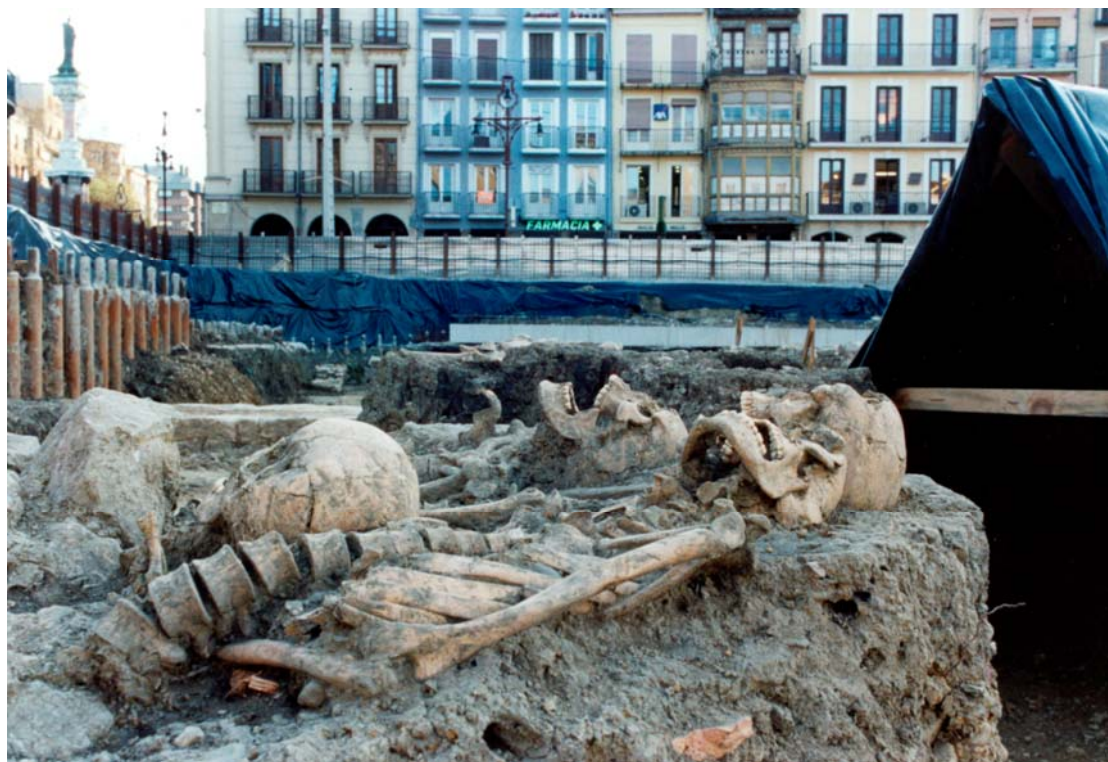
Figura 2. Detalle de la posición de los brazos del individuo D