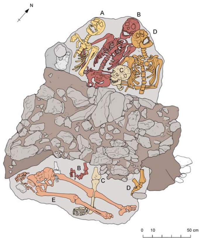
Figura 1. Disposición de los individuos