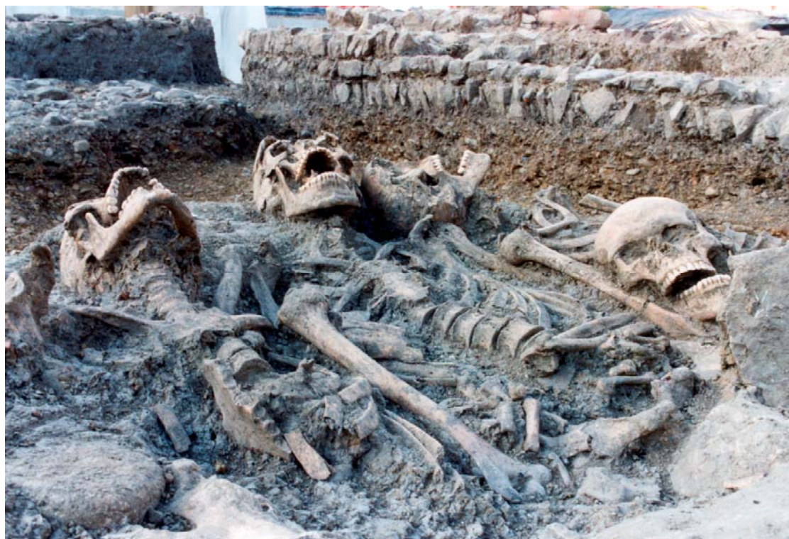
Figura 3. Detalle de los individuos inhumados