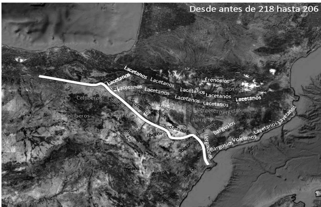
Fig. 2 Etnogeografía del norte del Ebro entre 218 y 206 a.C.