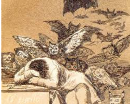
Illustration n° 5. Goya, Caprichos , gravure 43 « El sueño de la razón produce monstruos »