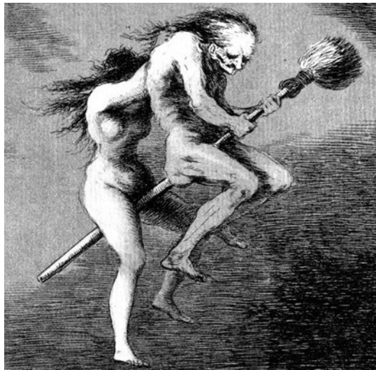
Illustration n° 4. Goya, Caprichos , gravure 68, « Linda maestra »