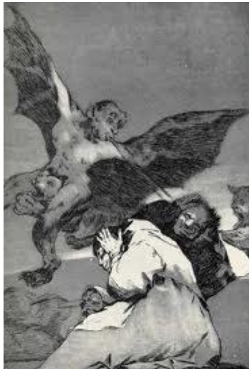
Illustration n° 6. Goya, Caprichos , gravure 48, « Soplones »