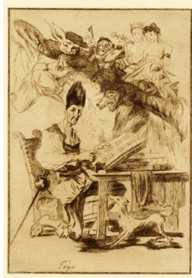
Illustration n° 1. Goya, « El Quijote y sus monstruos », dessin, 1780