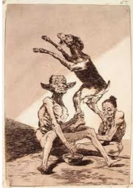
Illustration n° 3. Goya, Caprichos , gravure 67, « Aguarda que te unten »