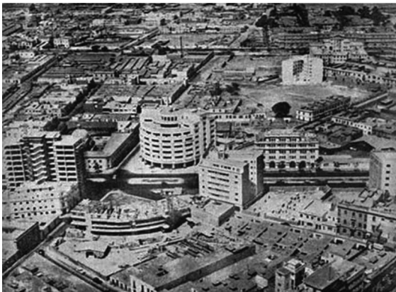
f5_Vista aérea del apenas terminado edificio Ferrand (Arq. Belaúnde) y de La Fénix en construcción (Arq. Seoane)

Inauguración del edificio Ferrand, Lima, 1948