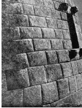
f1_Portada de la revista del número sobre la reconstrucción del Cusco después del terremoto del 21 de mayo del 1950

Foto Meza, Machu Picchu, El Torreón, 1950