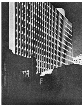
f2_Ministerio de Educación y Salud

En cuanto respecta a los temas del habitar contemporáneo en ámbito internacional, Belaúnde transforma la revista en un instrumento de observación, comparación e intercambio de experiencias con los colegas extranjeros. En América Latina, los avances en materia de arquitectura y urbanismo en países como Brasil encuentra amplia cobertura en este medio. El lenguaje de las nuevas construcciones en ciudades como Sao Paulo y Rio de Janeiro, como es el caso del Ministerio de la Educación y Salud en esta última ciudad ( f2 ), es publicado en la edición de marzo del 1944 8 . Además de éste, la participación de Brasil en el VI Congreso Panamericano de Arquitectura celebrado en Lima en setiembre del 1947 será publicado en octubre del mismo año, y Una Visita a Obras con Oscar Niemeyer publicada en noviembre del 1954, el número monográfico dedicado a Brasilia en el 1960, representan solo una parte de los artículos destinados por la revista a la practica en este país.