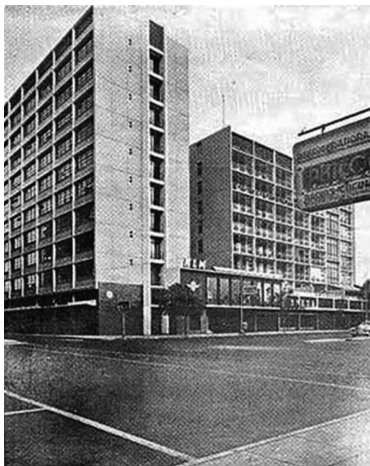
f6_Bloques de vivienda y oficinas del edificio Ostolaza Edificio Tacna-Nazarenas, Lima, 1955