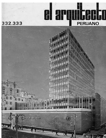
f7 Portada de la edición doble de setiembre y octubre en la cual se aprecia la solución de la esquina de El Banco Comercial Archivo El Arquitecto. El Banco Comercial. Nueva expresión de un viejo lenguaje. Lima. 1965