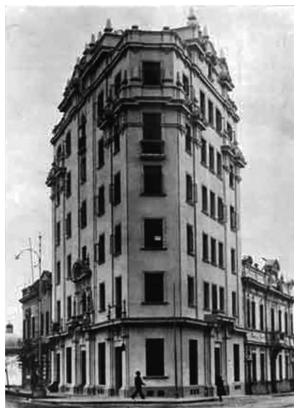
f4_Perspectiva de la fachada del edificio Rizo Patrón, Sin título, Lima, 1940