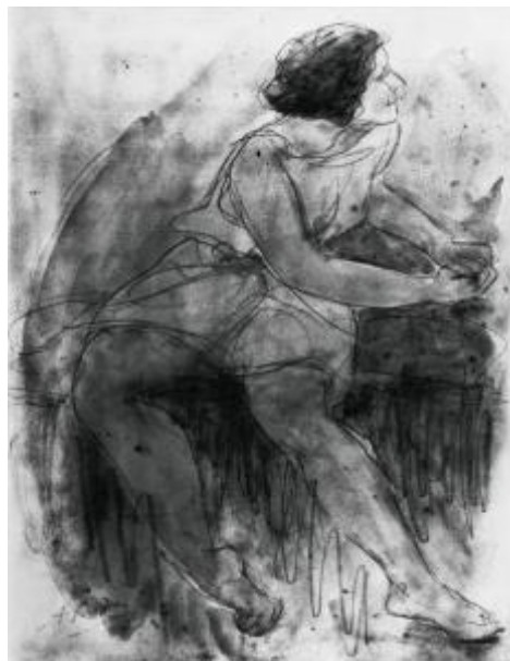
Ilustración 5: Isadora Duncan (Rodin, 1902)

La bailarina llegará a decir, inspirada en lo que veía en el estudio de Rodin, que “la danza y la escultura son dos artes íntimamente unidas y la base de ambas es la naturaleza. Tanto el escultor como el bailarín tienen que buscar en la naturaleza las formas más bellas y los movimientos con los que inevitablemente expresar el espíritu de estas formas” 89 .