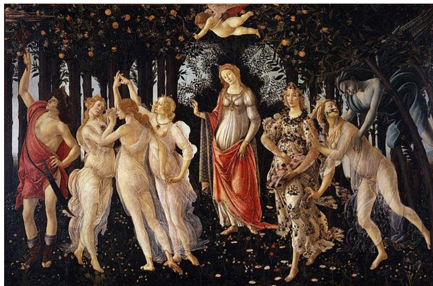
Ilustración 1: "La primavera" (Botticelli)

La inspiración principal de la bailarina es la cultura griega. El primer contacto de Isadora con la cultura clásica fue a través de una reproducción de la Primavera de Botticelli 2 . Más tarde, en sus viajes por Europa, pasaría largas horas delante del original. Refiriéndose a este diría: “bailaré este cuadro y transmitiré a los demás el mensaje de amor, de primavera y de creación de vida que yo he recibido con tanta emoción” 3 . El afán de Duncan por acercarse a la cultura griega le lleva a dedicar muchas horas a su estudio a lo largo de su carrera, pasará muchas en el British Museum , en las salas del Louvre buscando una danza a la manera de los griegos.