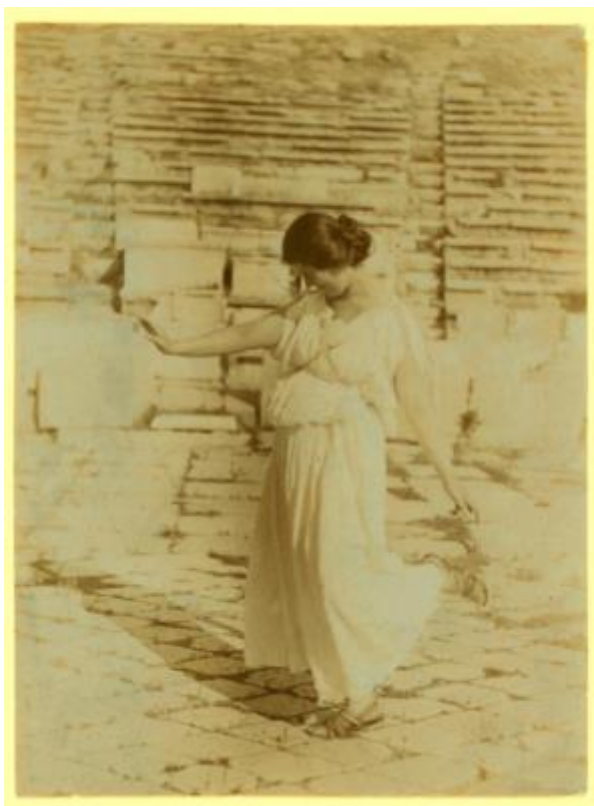
Ilustración 2: Isadora Duncan en el Partenón.

dar espíritu a la tragedia griega 15 . Esto se traduce en su afán por conseguir formar una escuela para alcanzar que la danza sea, entre otras cosas, una “expresión en comunidad”.