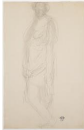
Ilustración 4: Dibujo de Isadora Duncan. (Rodin, 1911)

La bailarina llegará a decir, inspirada en lo que veía en el estudio de Rodin, que “la danza y la escultura son dos artes íntimamente unidas y la base de ambas es la naturaleza. Tanto el escultor como el bailarín tienen que buscar en la naturaleza las formas más bellas y los movimientos con los que inevitablemente expresar el espíritu de estas formas” 89 .