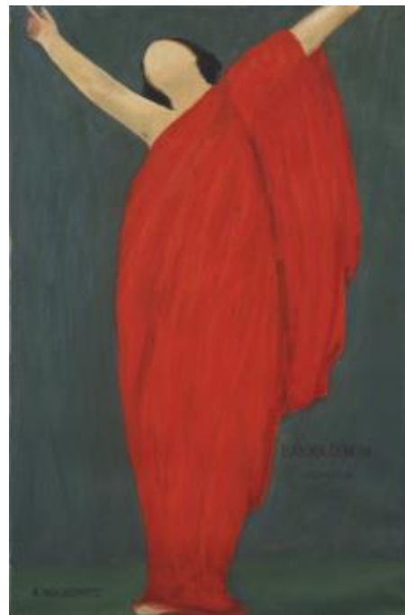
Ilustración 9: Dibujo en tinta de Isadora bailando (Walkowitz, 1906–1927)