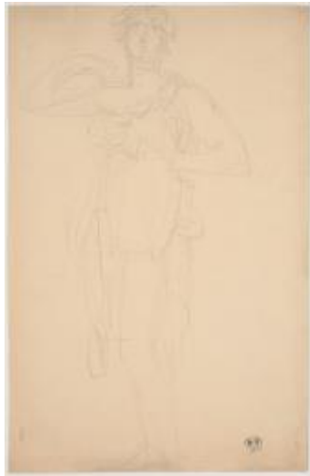
Ilustración 3: Dibujo de Isadora Duncan. (Rodin, 1911)

luego influirán en otros artistas que crucen su camino, como José Clará del que hablaremos más adelante.