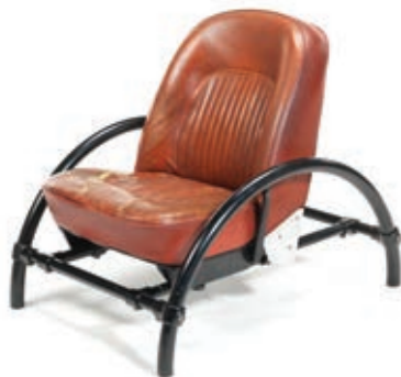
ROVER 1981 RON ARAD Compuesto por un asiento de automóvil Rover y tubos de acero curvado Kee Klamps.