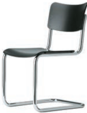
CANTILEVER 1925/1927 MART STAM Prototipos experimentales realizado con tuberías de gas.

Muebles de asiento realizados mediante reutilización de objetos, componentes o materiales.