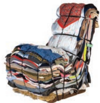
RAG 1991 TEJO REMY / DROOG Compuesto por capas de ropa y tela usada y compactada, unida por cintas en dos direcciones.