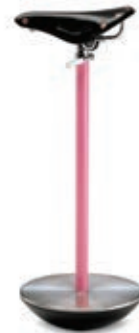
SELLA 1957 HNOS. CASTIGLIONI Compuesto por un asiento de bicicleta, una barra de acero tubular y un elemento hemisférico.