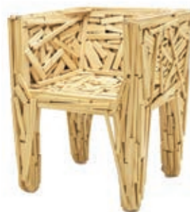
FAVELA 1991 HNOS. CAMPANA Compuesto por trozos de madera desechada encolados.