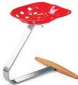
MEZZADRO 1957 HNOS. CASTIGLIONI Compuesto por un asiento de tractor, una estructura curva de acero y un travesaño de madera.