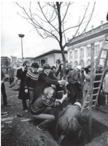
Fig. 04 Joseph Beuys, 7000 robles , Kassel (Alemania), 1982. La imagen muestra al artista plantando el primer árbol junto a la piedra de basalto acompañado por un grupo de ciudadanos. (Fuente: 7000 EICHEN. Joseph Beuys . CD-ROM. Fundación 7000 robles y Ministerio para la Ciencia y el Arte, Kassel).

Tanto Beuys como Calvino, dos figuras coetáneas e influyentes en sus respectivos campos, recurrieron en la segunda mitad del siglo XX a la contigüidad universal de materia, conceptos y formas para desarrollar sus creaciones. En el caso de Beuys, los planteamientos de contigüidad son prolongación de las experiencias vitales del artista, y sus Aktionen , flujos que conectan pasado, presente y futuro para sobrevivir al trauma de la guerra que le acompañó en vida y que el artista plasmó en sus trabajos empleando materiales poco estables que representan estados de transformación en evolución permanente 6 . Para Calvino se trataba de la construcción intelectual de un cuerpo literario concebido a través de un flujo de estados transitorios y continuos que, indistintamente y de manera libre, se mueven entre realidades distintas. De alguna manera ambos creadores abogaron con sus trabajos por una dimensión que trasciende la materialidad, fundamentando sus ideas y realizaciones en la transubstanciación de la obra y en la energía natural que le fue dada a la humanidad por encima de su realidad física, una substancia única y simbólica que relaciona el pensamiento, la materia y la forma mediante la contigüidad de los elementos que componen la obra.