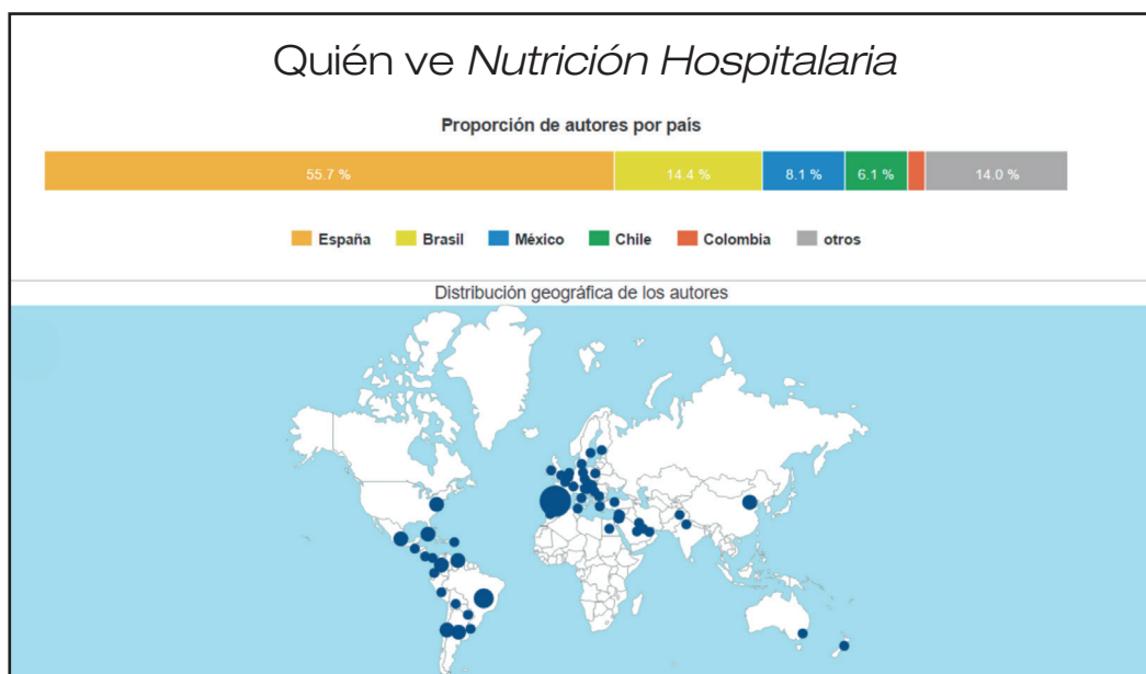
Figura 1. Distribución geográfica de la procedencia de artículos en 2016.

Probablemente eso que parecen debilidades constituyen, a su vez, sus fortalezas, como señalan, por ejemplo, el número de autores y de lectores de la revista en todo el planeta (Fig. 1) y el de descargas (el número de mayo-junio de 2016 recibió más de 50.000) (Fig. 2). El surgimiento de métricas alternativas como indicadores