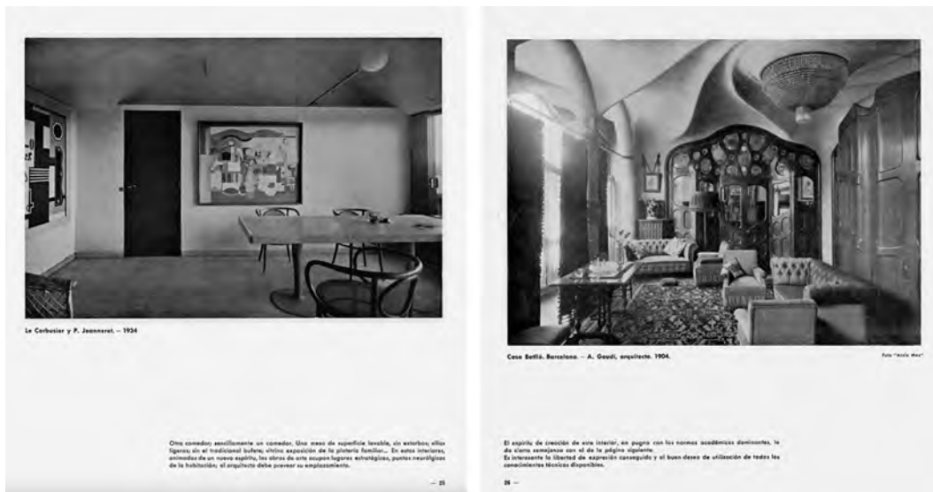
Figura 9: Imágenes Publicadas en la Revista A.C. en páginas consecutivas donde se muestran ejemplos de la obra de Le Corbusier y Gaudí.