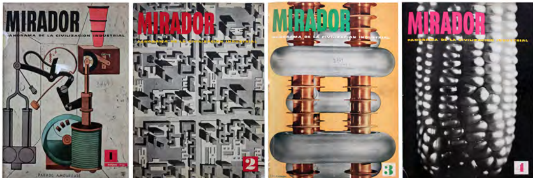
Figura 3: Portadas de Mirador Nros. 1-4

dedicación íntegra a la defensa de los postulados de la “nueva arquitectura”, así como por ser referentes de nueva visión, la nueva tipografía, las nuevas maneras de editar, las revistas Das Neue Frankfurt o Die Form , y textos como Internationale Architektur de Walter Gropius o, sobre todo, Vers une Architecture de Le Corbusier entre otros (Sanz Esquide, 2005). El trabajo editorial permitiría interiorizar mediante su práctica el nuevo espíritu (Acilu, 2017) (Figura 4).