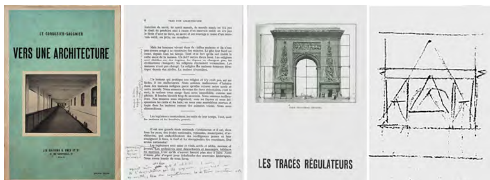
Figura 2: Ejemplar de Vers une Architecture anotado por Josep Torres Clavé (c.1927) Fuente: AHCOAC. Archivo Histórico del Colegio de Arquitectos de Cataluña. Le Corbusier (1923)

La renovada voluntad plasmada en las obras publicadas por Le Corbusier los impulsó a indagar en la historia, a recuperar referencias en nuevas claves, a mirar con una actitud que había gobernado el espíritu de los artistas del Renacimiento. Su objetivo sería, además de ampliar su conocimiento, forjarse una opinión que les permitiera encontrar una manera propia de hacer arquitectura guiada por ese nuevo espíritu al que tanto se apelaba en los foros de vanguardia. La visita en 1928 de Le Corbusier, y el consecuente paso por Sitges, determinó su compromiso con un legado construido que los jóvenes arquitectos tendrían presente en las sucesivas etapas de su carrera: el Mediterráneo. Como el propio Le Corbusier