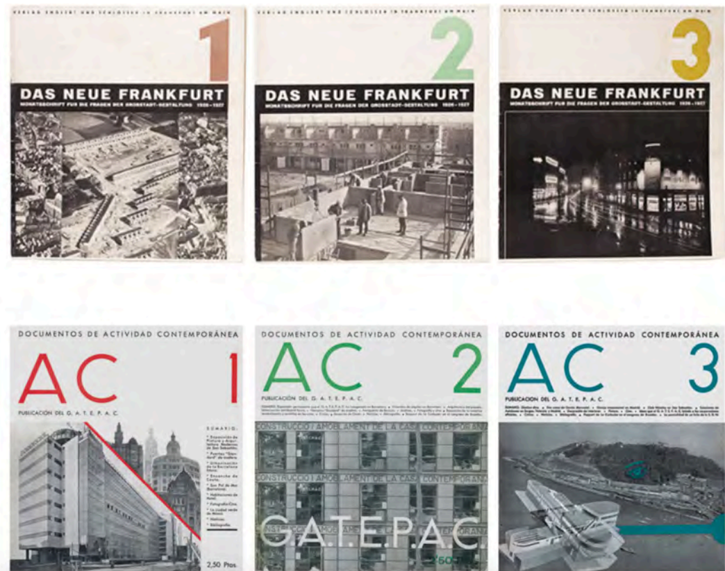
Figura 4: Comparativa entre portadas de las revistas Das Neue Frankfurt y A.C.

A.C. no era “una revista de arquitectura strictu sensu ” (López Rivera, 2012, p. 66); la revista supuso la unión de la teoría —a través de la articulación del manifiesto moderno, su debate, su crítica, sus referencias—, y la