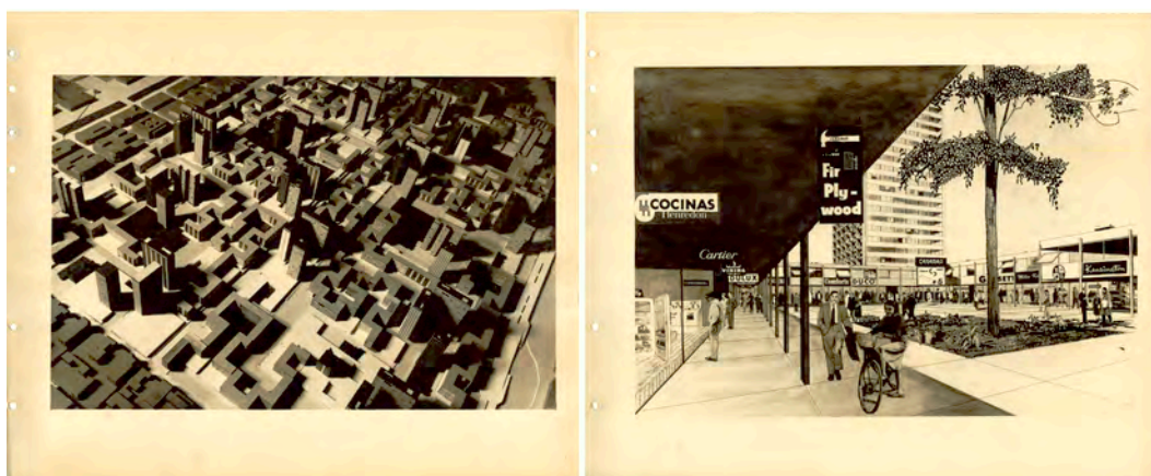
Figura 6: Modelo de Tejido urbano para el Barrio Sur-la vaca, la greca y la torre vertical- y perspectiva de urbana a pie de calle de unos de los sectores, Buenos Aires

El Plan del Barrio Sur hacía renacer postulados y decisiones de diverso carácter: por sus similitudes de orden y jerarquía a base de estructuras metálicas se asemejaba a las propuestas modulares de la década de los cincuenta; por sus buscados contrastes tenía implícito algo de la crítica al Plan del Bajo Belgrano, recibido por parte de los CIAM en la celebración del congreso de Bérgamo (Tabera, 2020); y aún más, por su historia, una deuda con su ciudad natal. Bonet diseñó el Plan para el futuro porteño volviendo a sus comienzos, a su querida Barcelona del GATCPAC, a su primer gran viaje por el Mediterráneo —con motivo del CIAM IV—. Las lecciones