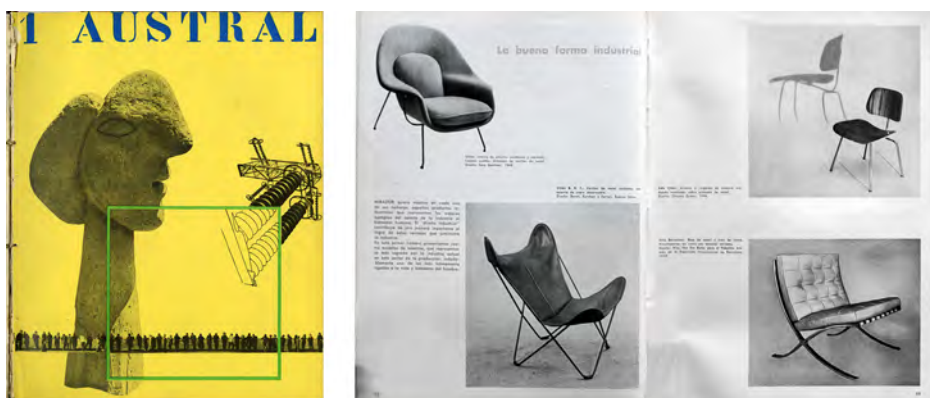
Figura 5: Portada del Manifiesto Austral. Artículo “La buena forma industrial”

La documentación gráfica del Plan se encuentra en el segundo número de Mirador ; así como repetida en otras tantas publicaciones argentinas y latinoamericanas 1 , españolas 2 , y actualmente en el archivo del COAC bajo el epígrafe DMR 48 157. El artículo redactado por Bonet y publicado en junio de 1957 tras ser presentado oficialmente a las autoridades, fue fiel reflejo de las particularidades formuladas en el anteproyecto.