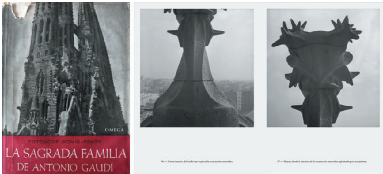
Figura 2. Pliego del “fotoscop” La Sagrada Familia de Antonio Gaudí , 1952.