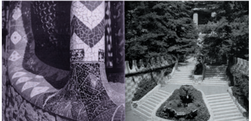
Figura 8. Fotografía volteada en Milán, recogida en el "fotoscop" El Park Güell de A. Gaudí , 1966.