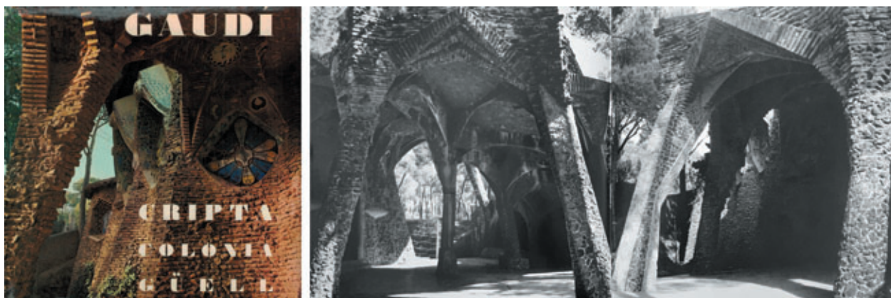
Figura 4. Portada del “fotoscop” Gaudí. Cripta de la Colonia Güell , 1972.

una mera concatenación de escenas, sucesos y detalles inconexos que tenían como único vínculo la noche parisina. Las imágenes no albergaban, como sí ocurrirá en los “fotoscops” de Gomis y Prats, una unidad compositiva visual o narrativa.