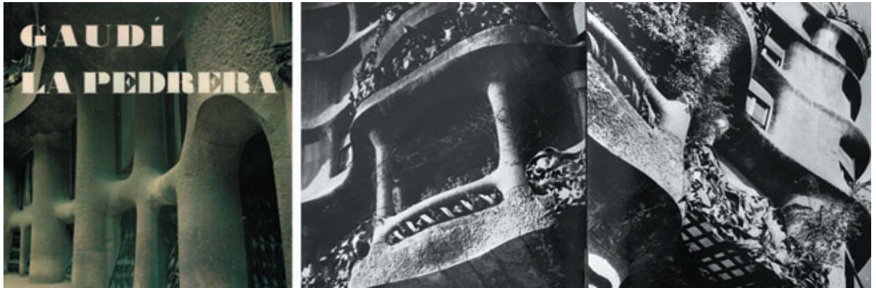
Figura 5. Pliego del “fotoscop” Gaudí. La Pedrera , 1972.

Así pues, superado el valor individual y siempre fragmentario de la fotografía, la oportuna reunión de un conjunto de estos fragmentos fotográficos, pertenecientes todos ellos siempre a un determinado tema —sea un lugar, como la isla de Ibiza; un edificio, como la Catedral de Tarragona; un espacio, como el taller de Joan Miró, o un motivo más amplio, como los rincones de la Barcelona modernista, la artesanía tradicional popular o las arquitecturas de Antoni Gaudí— permite obtener una impresión no sólo más amplia, sino más profunda de las cualidades plásticas del motivo fotografiado.