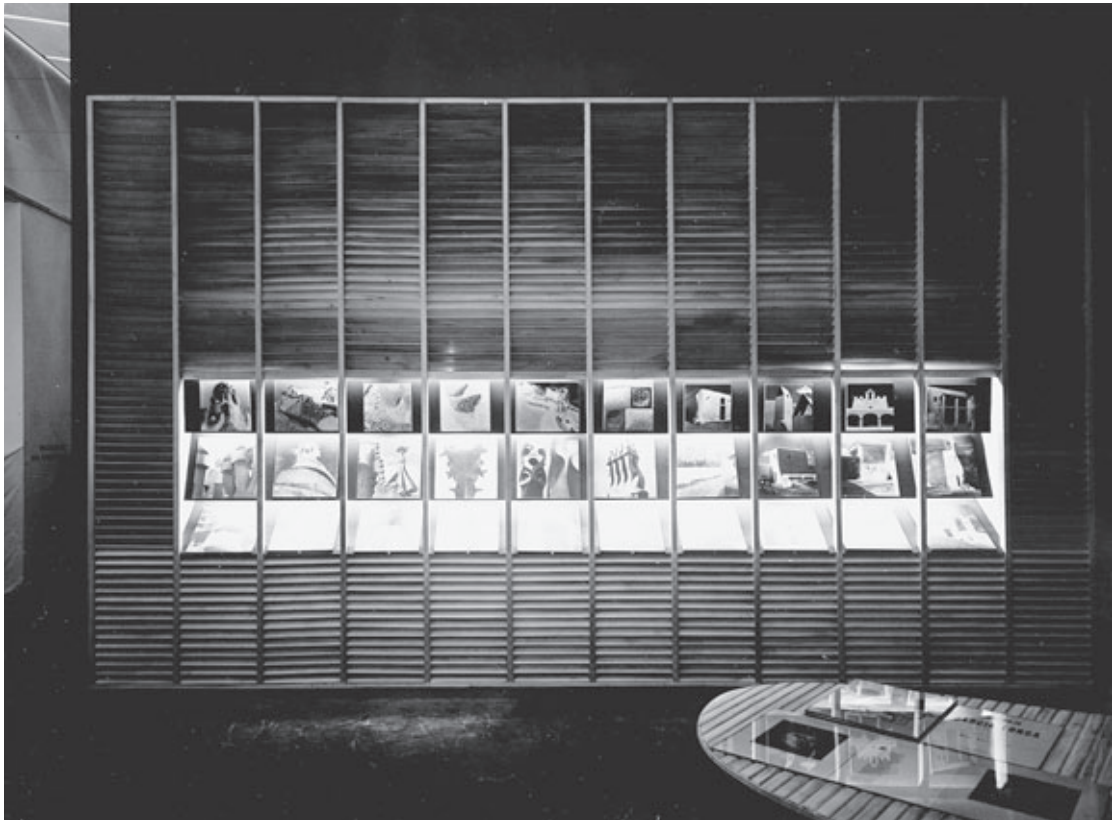
Figura 7. Expositor fotográfico instalado en la sección española de la IX Trienal de Milán, 1951.

habían atisbado durante los primeros años treinta, al tiempo que, en 1967, año de la publicación del “fotoscop” Ibiza, fuerte y luminosa , elevaba una última llamada a salvaguardar de su desvanecimiento aquel mundo atávico, entonces en peligro de extinción.