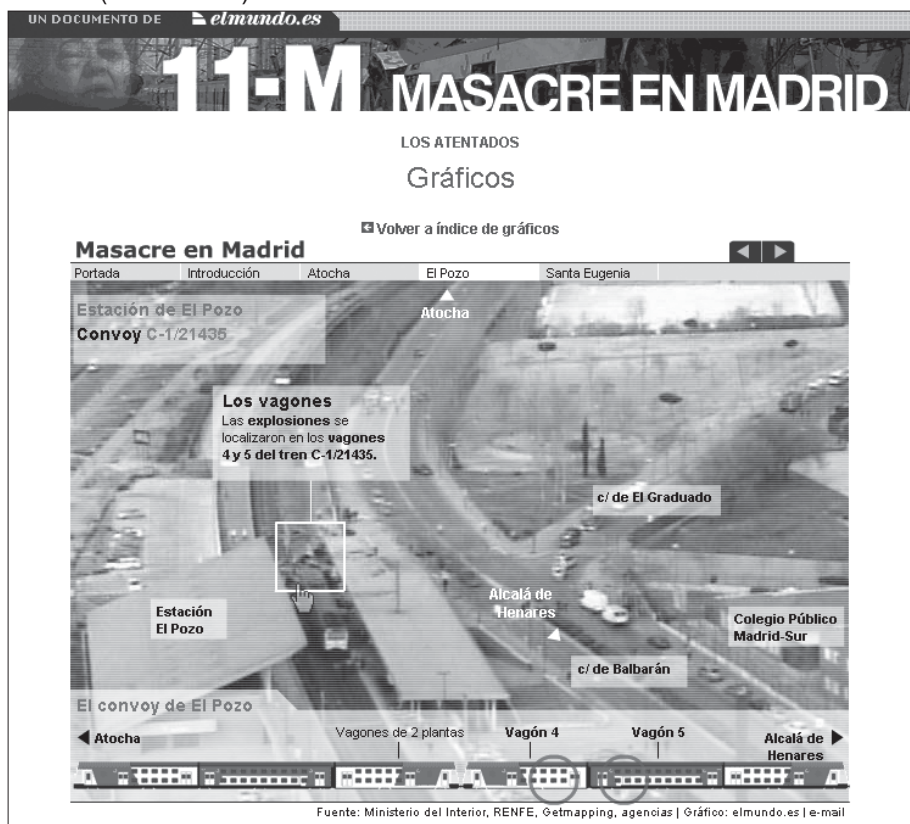
Figura 5.3. Infográfico multimedia de Elmundo.es que recurre a una fotografía estática para explicar los atentados del 11 de marzo de 2004 en Madrid (12/03/2004).

como su producto estrella y colocan llamadas especiales a ellos en sus portadas. Y en cierto modo, los gráficos se están haciendo populares: los ofrecen muchos más medios.