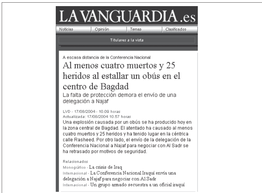
Figura 5.1. Lavanguardia.es data con exactitud las noticias de última hora, así como sus actualizaciones.

Esta técnica es común ya entre los géneros informativos y, más aún, entre los interpretativos, puesto que éstos últimos se preocupan especialmente por aportar explicación y contexto. En cambio, los géneros de carácter dialógico y, sobre todo, los argumentativos, recurren mucho menos a los enlaces documentales dado su mayor carácter autorreferencial.